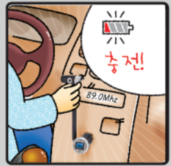
① S100을 GFT-5000 연결하면 충전이 가능합니다.

-휴대용 오디오 기기 음악감상 재생 : 휴대용 오디오기기의 재생 버튼을 누릅니다. 볼륨 조절 : 차량용 오디오의 볼륨을 적당히 조정하세요. (가장 좋은 음질로 감상하기 위해서는 휴대용 오디오기기의 최대볼륨에서 70~80% 정도로 조정하는 것이 좋습니다.)