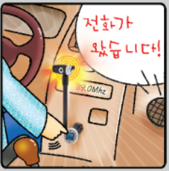
③ 전화가 올 경우, 음악이 멈추고 벨이 울립니다.