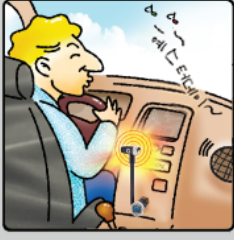
⑤ 통화가 끝나면 음악이 자동으로 재생됩니다.