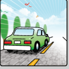
⑥ 즐거움과 편리함을 가져다 주는 나만의 모바일 친구 모비프렌!!