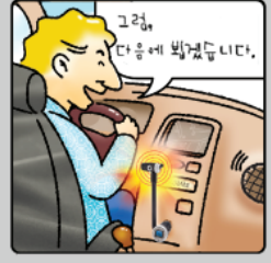
④ 운전 중에도 안전하게 통화가 가능합니다.