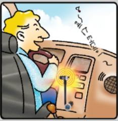
② GFT-5000의 주파수와 FM 라디오의 주파수를 동일하게 맞추어 MP3P 음악을 들으실 수 있습니다.